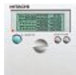
Mando a distancia semanal